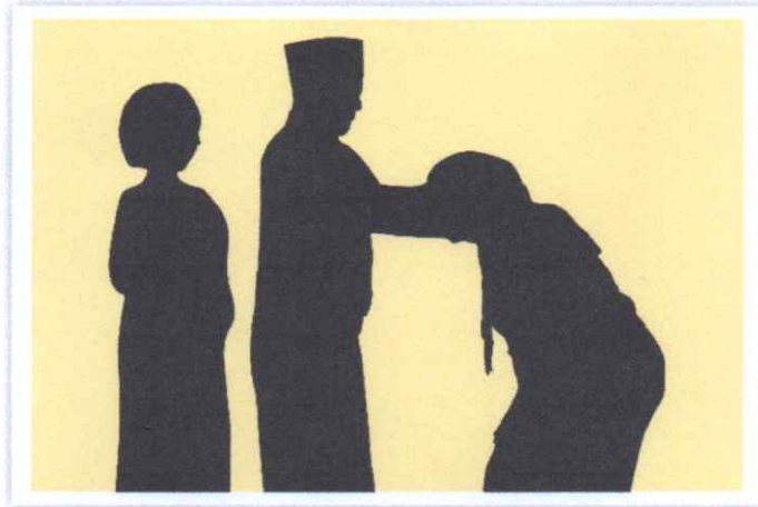
1. Foto pengalungan samir oleh orang tua / wali kepada calon wisudawan